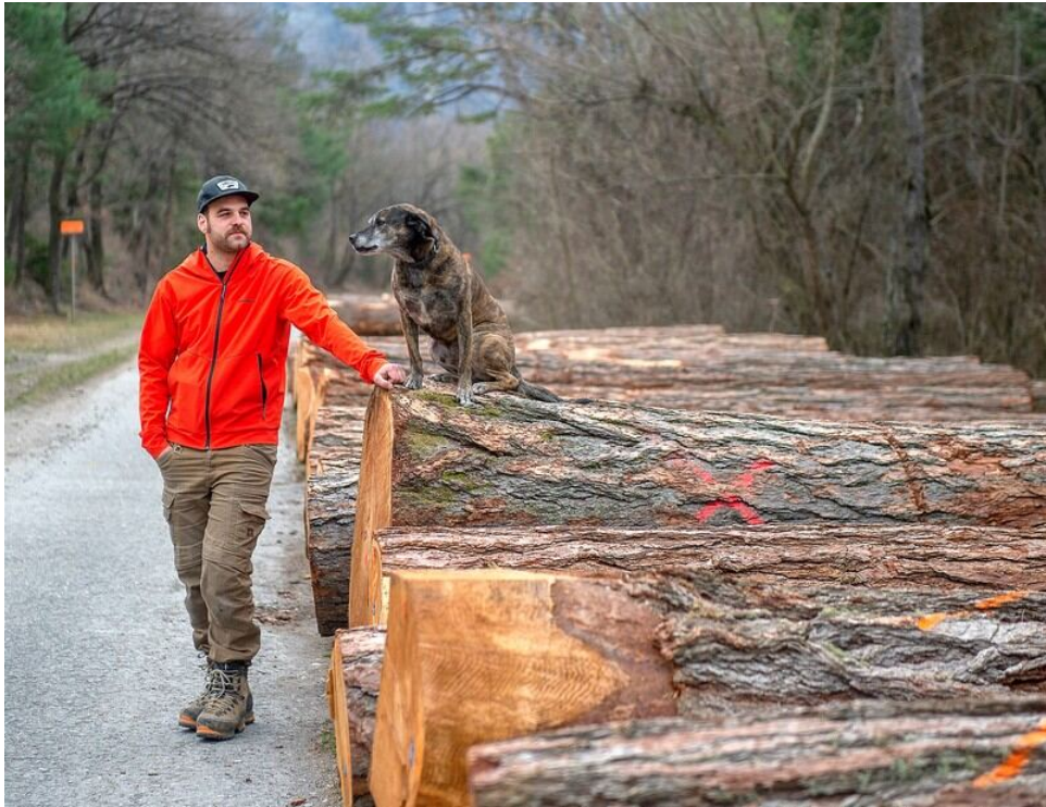
Flury Mitinitiant Wertholz-Submission