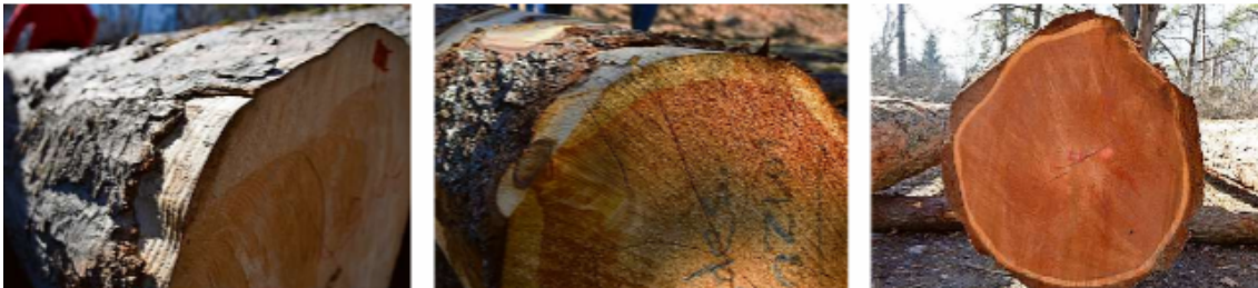
Von links nach rechts: Bergahorn, Arvenstamm und Lärche.

Schön aufgereiht: An der ersten Wertholz- Submission Graubündens standen knapp 1500 Kubikmeter Holz zum Verkauf.